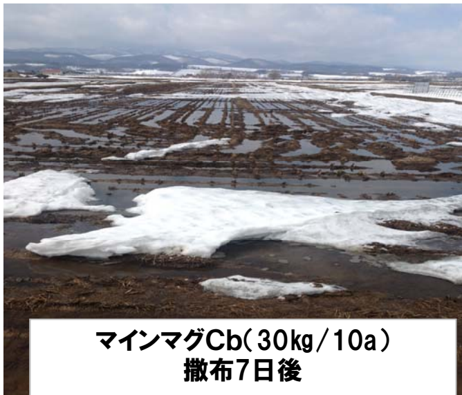
マインマグCb(30kg/10a) 撒布7日後